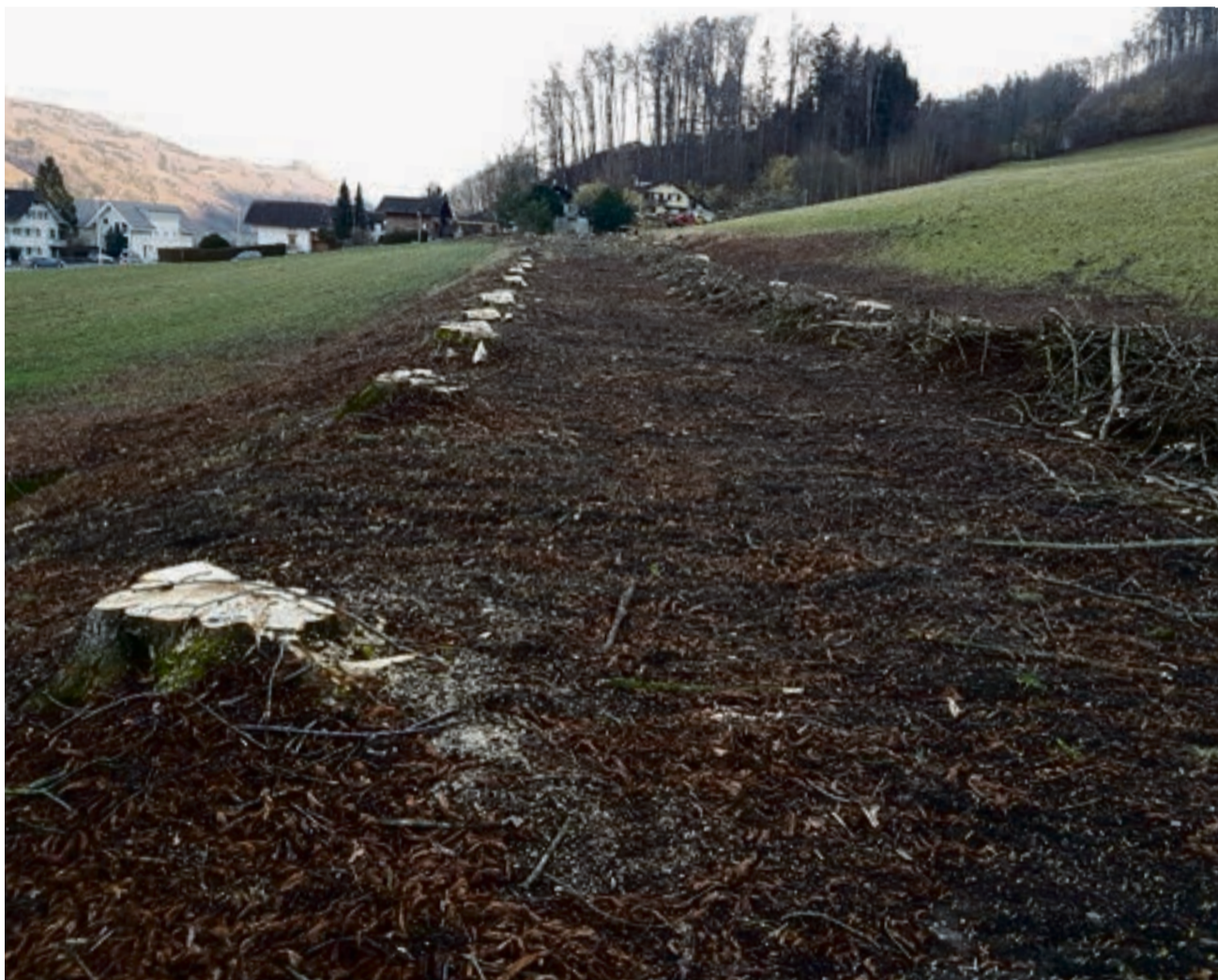
Keineswegs alle krank. Vielmehr waren die meisten der Rosskastanien stark: «Menschen wachsen irgendwann auch nicht mehr weiter, dennoch reifen sie. Wenn manche Baumart älter wird, wird sie hohl – das ist keine Krankheit. Dieser Platz bietet Tieren Lebensraum. So hat es die Natur vorgesehen.»