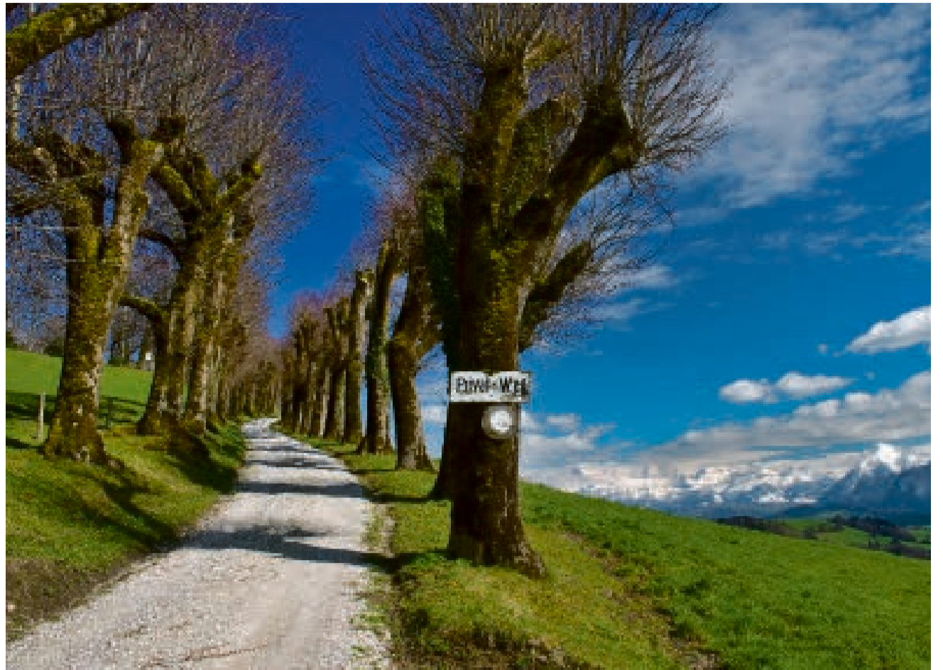
Die private Lindenallee in Burgstein.